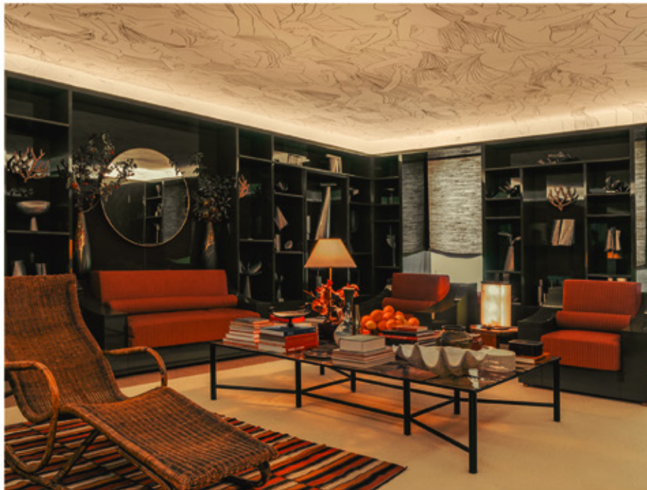
. AD Intérieurs : présentation de Fabrizio Casiraghi septembre 2018