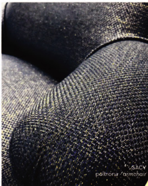
GACY poltrona / armchair