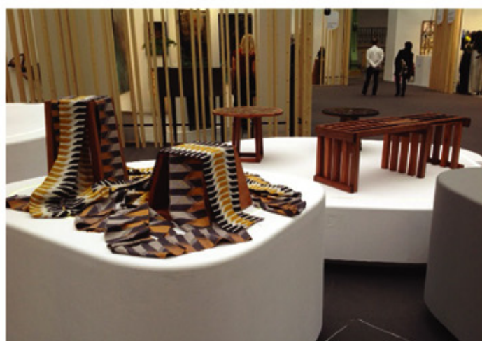
. Grand Palais au sein du Salon des Métiers d'Art " Révélations " en 2015 et 2017