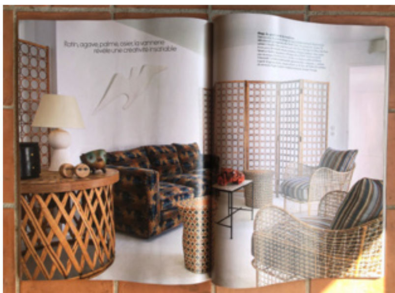
Tissus réalisés pour les fauteuils Publication dans Elle décoration n°287, Avril 2021