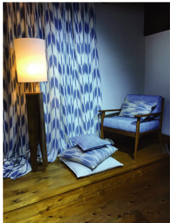
. Exposition au Japon au sein de la compagnie Okujun : Octobre 2018