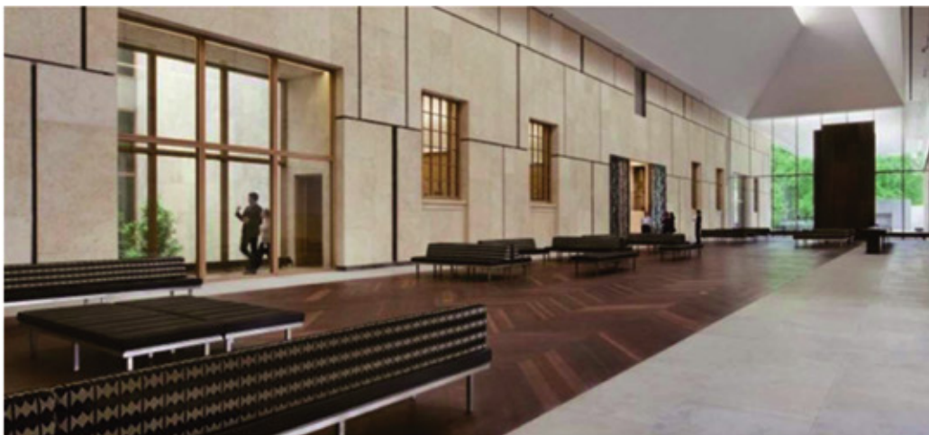
Barnes fondation 2012 Philadelphie USA