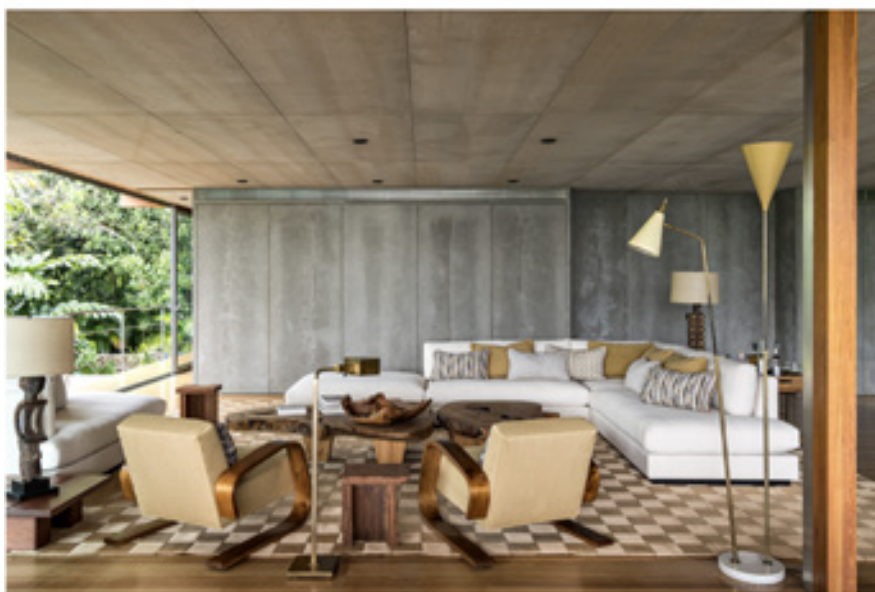
Studio Mellone projet au brésil, réalisation de coussins, 2019