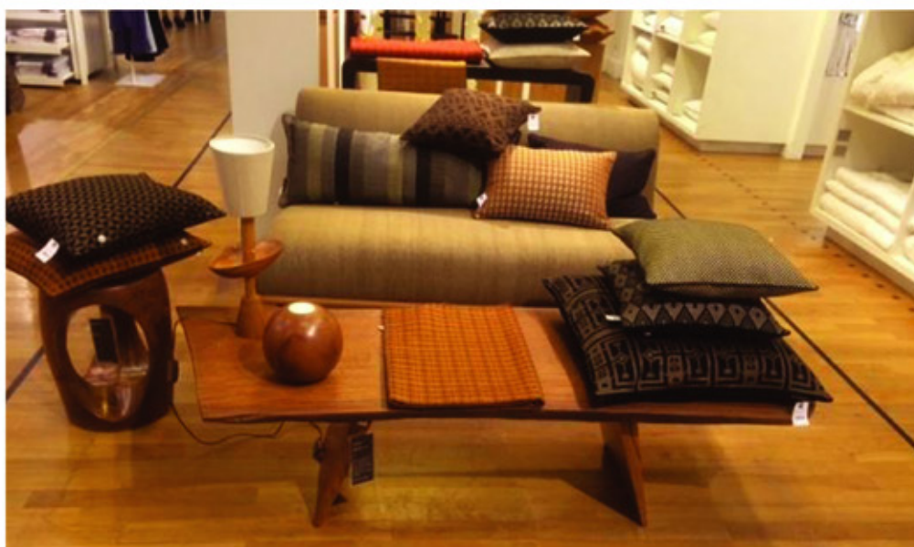
En 2013 au sein du grand magasin " Le Bon Marche "