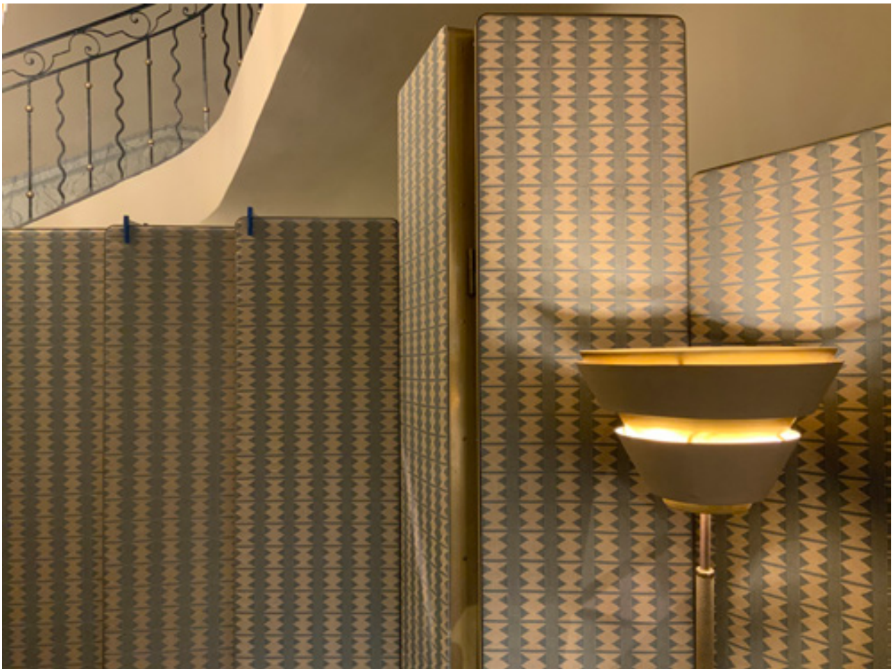
Boutique DIOR Saint-Tropez, Réalisation paravant, fauteuils et revêtement mural en collaboration avec Dimore studio