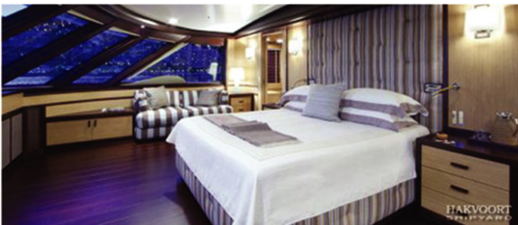
Pamela V superyacht luxury interiors