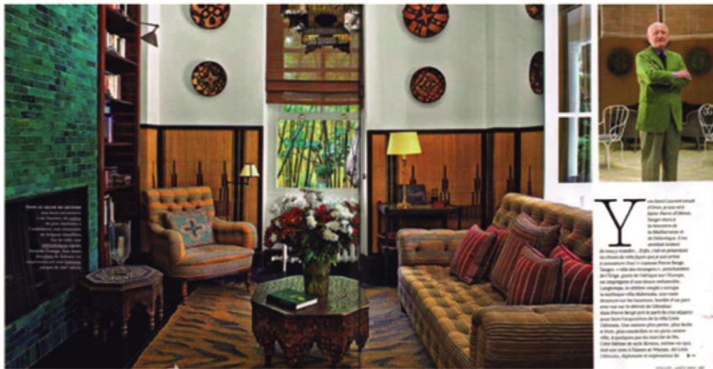
Maison de Pierre Bergé et Yves Saint Laurent à Tanger MAROC