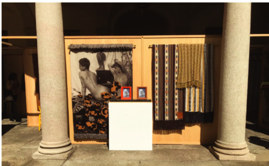
Salon du design de Milan avril 2018 : Maison LOEWE Via Montenapoleone